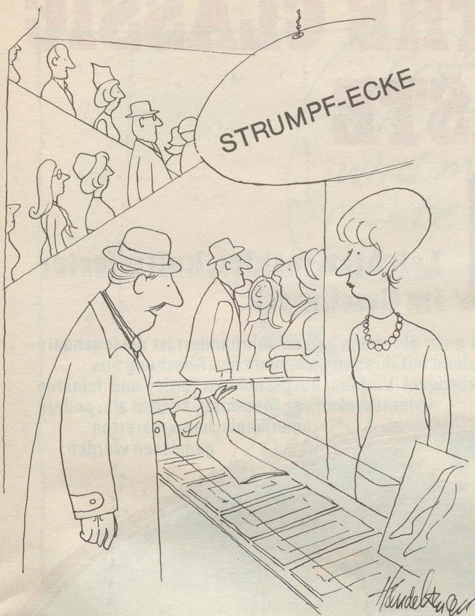
«Ich suche etwas, das den ganzen Kopf bedeckt und entweder mit einem blauen oder braunen Bankräuber-Anzug getragen werden kann!»

gschüttlet. «Gället, das isch e Chue, dert?» machen i zue re. – «Ja, naadisch isch das e Chue!» seit sie ganz lut; i ha guet gmerkt, es wohlet ere grad, ihrem Erger chönne Luft z'mache. –