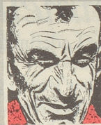
Us em Innerrhoder Witz- tröckli

* PS. Karl Spitteler nahm 1900 die Arbeit an seinem Versepos «Der olympische Frühling» auf. Spitteler erhielt den Nobelpreis für Literatur; 1901 nahm die Nobelstiftung ihre Tätigkeit auf.