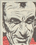
Us em Innerrhoder Witztröckli

* PS. Karl Spitteler nahm 1900 die Arbeit an seinem Versepos «Der olympische Frühling» auf. Spitteler erhielt den Nobelpreis für Literatur; 1901 nahm die Nobelstiftung ihre Tätigkeit auf.