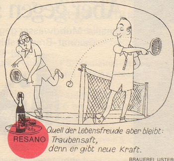
Quelle der Lebensfreude aber bleibt: Traubensaft, denn er gibt neue Kraft.

«Ich stehe hinter jeder Regierung, bei der ich nicht sitzen muß, wenn ich nicht hinter ihr stehe.» bi