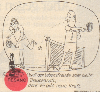
Quelle der Lebensfreude aber bleibt: Traubensaft, denn er gibt neue Kraft.

«Ich stehe hinter jeder Regierung, bei der ich nicht sitzen muß, wenn ich nicht hinter ihr stehe.» bi