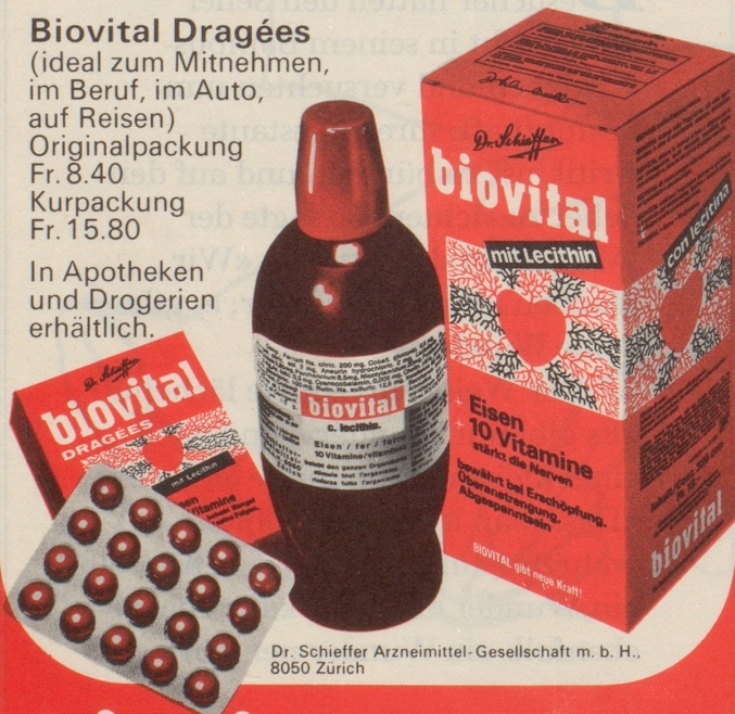
Dr. Schieffer Arzneimittel-Gesellschaft m. b. H., 8050 Zürich

biovital gibt neue Kraft und frische Energie!