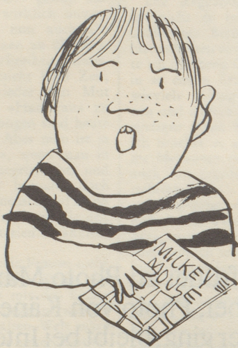
«I wott kei Gäld verdiene ...»