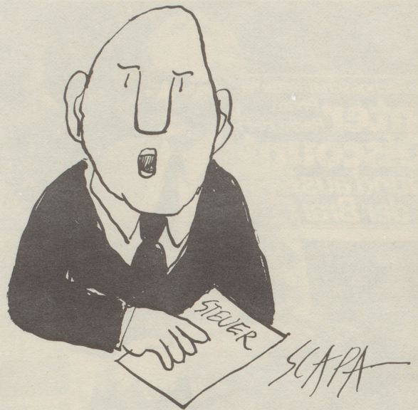
«I muess Gäld verdiene ...»