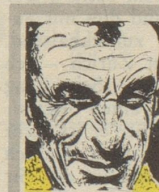
Us em Innerrhoder Witz- tröckli

Denn damit, dass man schreibt, wie es wirklich war, verkauft man heute keine Bücher. Weil nicht ist, was nicht sein darf.