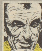
Us em Innerrhoder Witz- tröckli

Denn damit, dass man schreibt, wie es wirklich war, verkauft man heute keine Bücher. Weil nicht ist, was nicht sein darf.