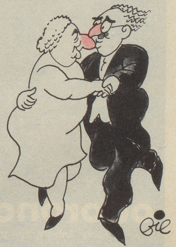
Golda und Groucho Marx