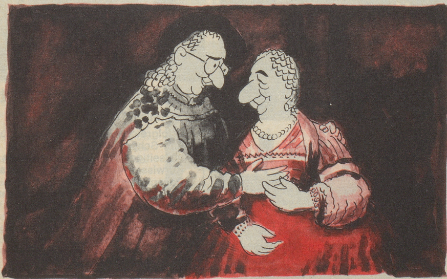
Die Judenbraut, nach Rembrandt