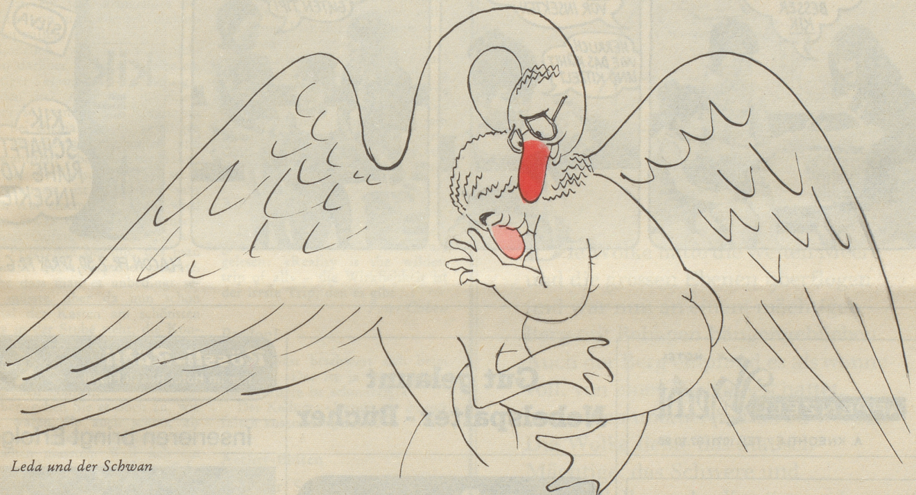
Leda und der Schwan