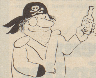
Bierat, von Scapa gezeichnet

Item, um's kurz, beziehungsweise nicht noch länger zu machen: Kürzlich sass ich bei Dings (essbar) und Dings (auch essbar) und Dings (flüssig zum Trinken) in einem Zürcher Lokal, dessen neuer Besitzer sich uns vorstellte. Auf dem Tisch lag, von Messer und Gabel und derlei nun einmal abgesehen, eine Broschüre für alle Presse-menschen. Zum Mitnehmen. Zum