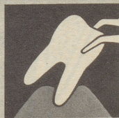
Ist das Zahnfleisch krank, so bildet es sich zurück – immer mehr. Endstufe – Zahnausfall!