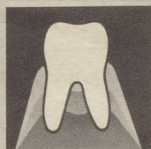
Gesundes Zahnfleisch gibt den Zähnen festen Halt.

Parodontose (Zahnfleischschwund) ist heute die Zahnkrankheit Nr. 1. Die meisten Zähne gehen infolge Parodontose verloren. So weit dürfen wir es nicht kommen lassen. Darum neoSelgin. Diese besondere Zahnpaste regeneriert und festigt das Zahnfleisch. Denn neoSelgin enthält hypertonisch wirkendes Meersalz – man spürt's!