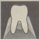
Gesundes Zahnfleisch gibt den Zähnen festen Halt.

Parodontose (Zahnfleischschwund) ist heute die Zahnkrankheit Nr. 1. Die meisten Zähne gehen infolge Parodontose verloren. So weit dürfen wir es nicht kommen lassen. Darum neoSelgin. Diese besondere Zahnpaste regeneriert und festigt das Zahnfleisch. Denn neoSelgin enthält hypertonic wirkendes Meersalz – man spürt's!