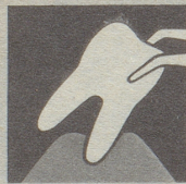
Ist das Zahnfleisch krank, so bildet es sich zurück – immer mehr. Endstufe – Zahnausfall!