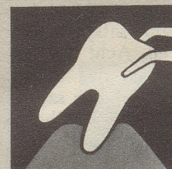
Ist das Zahnfleisch krank, so bildet es sich zurück – immer mehr. Endstufe – Zahnausfall!