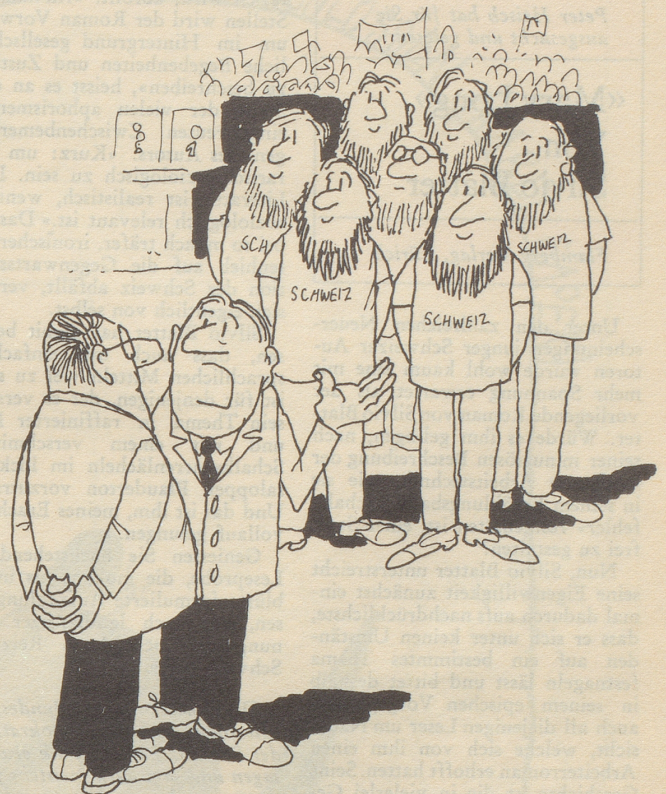
«Aber Herr Ober-Schiedsrichter, wieso glauben Sie, dass das eine Schleichwerbung für den Archipel Gulag sei?»