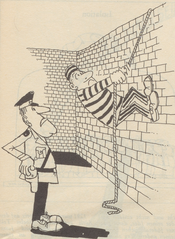
«Ja sag einmal – trainierst du wirklich nur für das «Spiel ohne Grenzen?»»