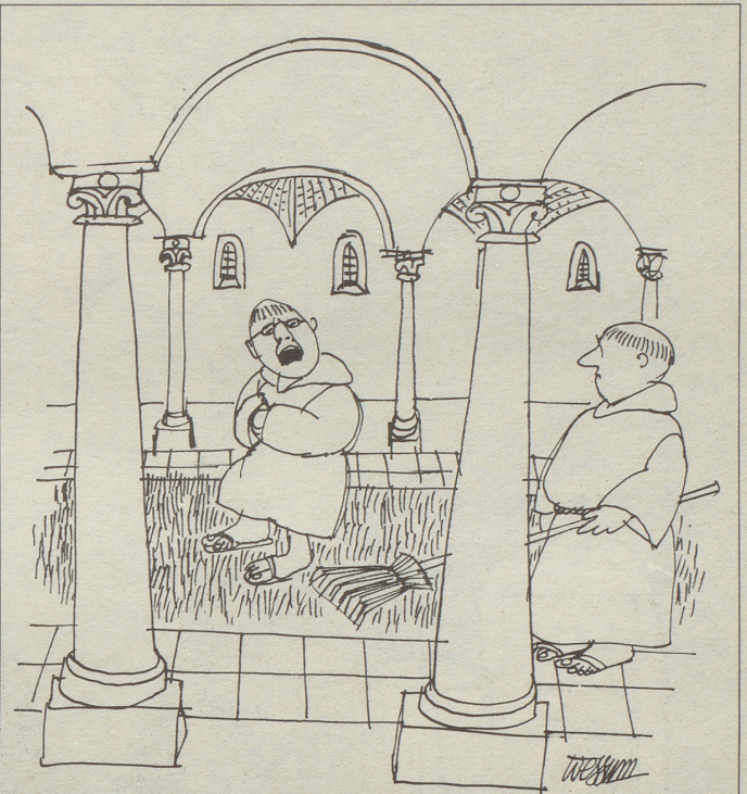
«Wie soll ich meine Bussübung absolvieren, o Bruder, wenn du mir laufend die stechenden Disteln und brennenden Nesseln aus dem Wege räumst?»