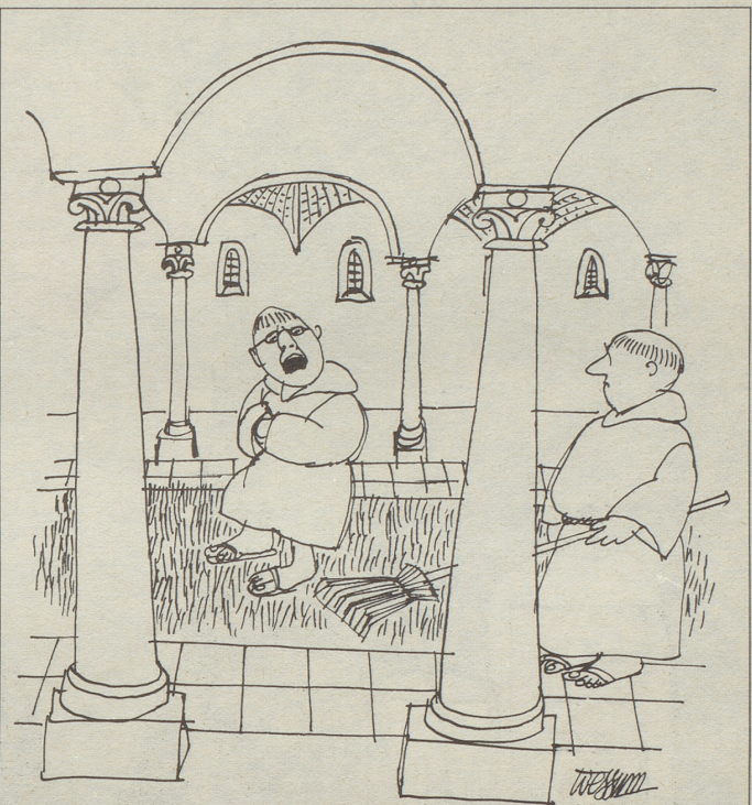
«Wie soll ich meine Bussübung absolvieren, o Bruder, wenn du mir laufend die stechenden Disteln und brennenden Nesseln aus dem Wege räumst?»