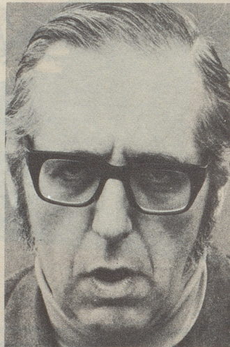
Georg Kreisler: Kabarett wird hier zur Konfrontation mit den Schrecknissen der Gegenwart.

ins Wort zu fallen. Doch auch der steckt in seiner Rolle. Und im grossen Vermarktungsprozess, im Spiel von Angebot und Nachfrage, hilft es ihm auch nicht viel, wenn er die Revolution in seinem Bewusstsein schon vollzogen hat. Denn