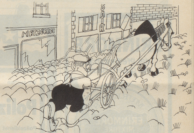
Die Bestellung der Bahnhofstrasse