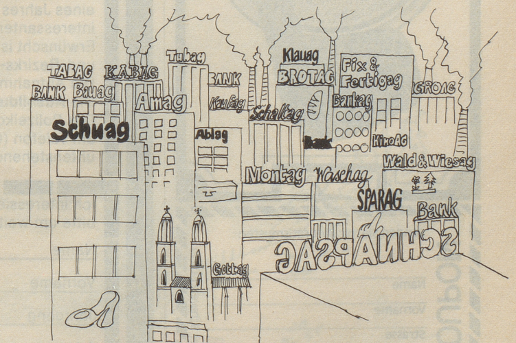
Die Städter, nicht aber die Geschäfte, ziehen sich aus der Stadt zurück. Das Stadtbild wird einheitlicher.