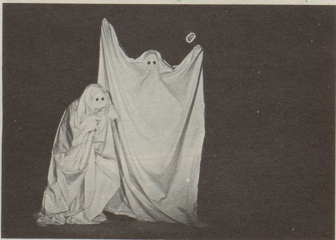
Unten: Die Gespenster