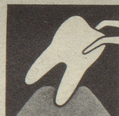
Ist das Zahnfleisch krank, so bildet es sich zurück – immer mehr. Endstufe – Zahnausfall!