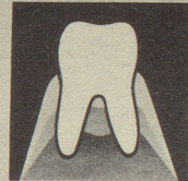
Gesundes Zahnfleisch gibt den Zähnen festen Halt.

Zahnfleischprobleme sind heute die Zahngefahr Nr. 1. Die meisten Zähne gehen infolge Zahnfleischproblemen verloren. So weit dürfen wir es nicht kommen lassen. Darum neoSelgin. Diese besondere Zahnpaste regeneriert und festigt das Zahnfleisch. Denn neoSelgin enthält hypertonisch wirkendes Meersalz – man spürt's!