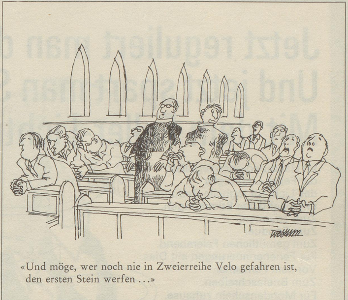
«Und möge, wer noch nie in Zweierreihe Velo gefahren ist, den ersten Stein werfen...»

Da beschloss ich, meine Aktien zu verkaufen und inskünftig Gartenstühle zu spritzen, Autos zu reparieren, Gärtnerarbeiten zu verrichten oder als Raumpfleger aufzutreten. Damit gehöre ich nun zwar nicht mehr zu den Kapitalisten, sondern zu der ausgebeuteten Arbeiterklasse – aber es ist einfach viel rentabler!