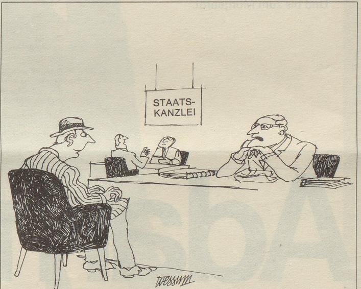
«Drücken Sie sich bitte klar und deutlich aus, wir sind hier nicht bei Tatsachen und Meinungen am Fernsehen!»