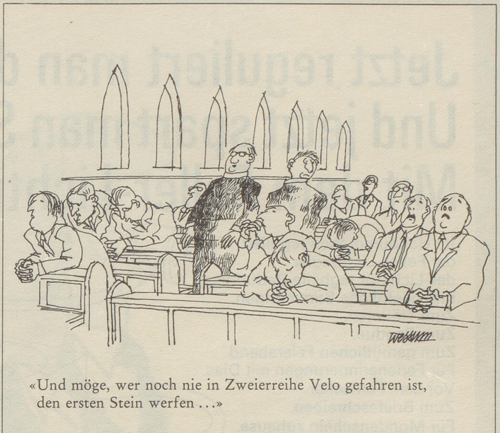
«Und möge, wer noch nie in Zweierreihe Velo gefahren ist, den ersten Stein werfen...»

Da beschloss ich, meine Aktien zu verkaufen und inskünftig Gartenstühle zu spritzen, Autos zu reparieren, Gärtnerarbeiten zu verrichten oder als Raumpfleger aufzutreten. Damit gehöre ich nun zwar nicht mehr zu den Kapitalisten, sondern zu der ausgebeuteten Arbeiterklasse – aber es ist einfach viel rentabler!