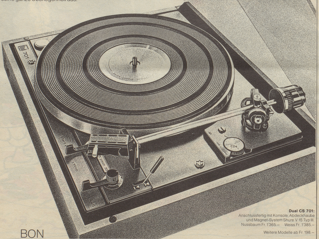
Dual CS 701: Anschlussfertig mit Konsole, Abdeckhaube und Magnet-System Shure V 15 Typ III. Nussbaum Fr. 1'365.- Weiss Fr. 1'385.-

Wo Musikhören mehr als ein Hobby ist, wo Anspruchsvolle höchste Ansprüche stellen, da spielt dieser elektronische Plattenspieler seine ganze Überlegenheit aus.