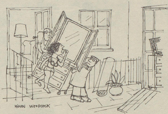
«Ich habe Sie nicht so früh erwartet ...»

Vater merkt, dass da Susis, Gabis, Monis und Bärbis telefonieren, schreiben, an der Türe läuten oder auf der Strasse zum Mansardenfenster des Sohnes hinaufpfeifen. Eines Tages beginnt er aber hartnäckig, sich für diese weiblichen Wesen zu interessieren. Bei einer Einladung gibt er sich gönnerhaft, charmant und sehr aufgeschlossen. Bald aber beginnt er die Favoritinnen des Sohnes zu «sezieren». Er betreibt Ahnenforschung und stellt Mutmassungen an über ihre äusserliche und innerliche Wandlung. Dem Sohn wird es allmählich zuviel. Schliesslich ist er ja noch nicht auf Brautschau. Er bereut, seine Kameradinnen der Familie vorgeführt zu haben. Er findet sie in der Gegenwart lustig, originell und unterhaltend und macht sich keine Gedanken darüber, ob sie zur Matrone oder zur Xanthippe werden könnten.