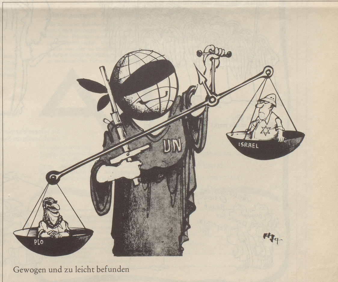
Gewogen und zu leicht befunden