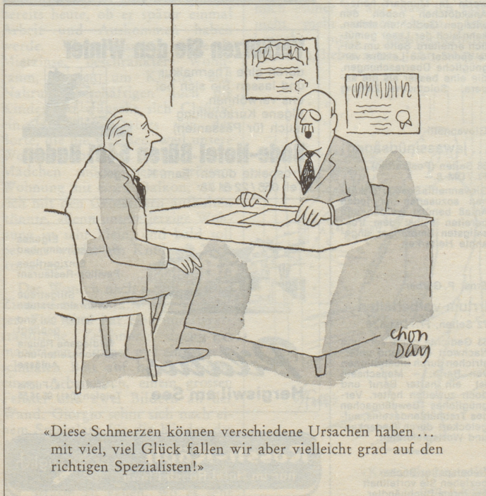
«Diese Schmerzen können verschiedene Ursachen haben ... mit viel, viel Glück fallen wir aber vielleicht grad auf den richtigen Spezialisten!»