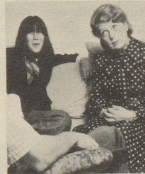
... beim Sprechen