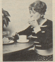
... beim Essen

Smig ist ein spezielles Haftkissen aus weichem Plastik, das leicht einzusetzen ist als Polster zwischen Kiefer und Prothese. Schmiegsam passt es sich der Form des Kiefers an, hält das Gebiss fest, ist hygienisch, völlig geruchlos und angenehm, sowie absolut unschädlich. Mit Smig schmerzt Ihr Zahnfleisch nicht mehr.