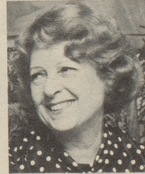
... beim Lachen