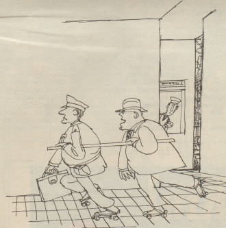
«... es spart Benzin, es hält mich warm und es bringt mich sogar fünf Minuten früher an Ort und Stelle als der Rolls!»