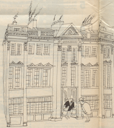
«Sie haben keine Ahnung, was diese Oelkrise für vornehme Leute bedeutet!»