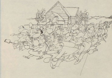
«Jemand, der nach Gold schürfen wollte, stieß auf Erdgas!»