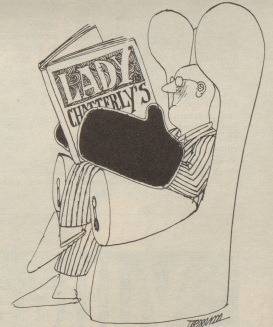
Wärme ohne Zentralheizung