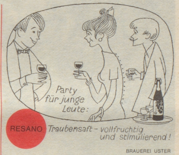
RESANO Traubensaft - vollfruchtig und stimulierend! BRAUEREI USTER