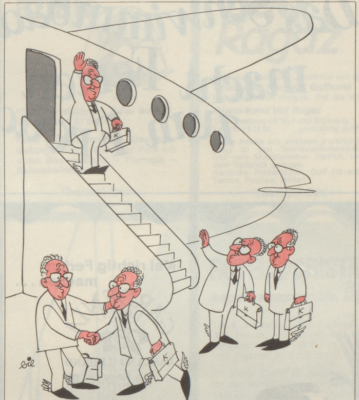
Die Kissinger Brothers

Rechtmässige Gewalt hat auch am Zürcher Hegibachplatz Recht zu schaffen § Wohnstatt zu zerstören und Rechtsstaat zu erhalten § Vielleicht bereits rechtmässig geschehen, falls Rechtmässigkeit nicht § Warten musste aus taktischen Gründen bis nach den Wahlen § Warum nicht den vielgebrauchten Solschenizyn § Lasst mich ihn auch gebrauchen § Einladen auf die Ehrentribüne, dass er beiwohne im Morgengrauen § Der Dichter ist zuständig für grauende Morgen § Wenn griffkundige Akteure der Rechtsgewalt mit den Befehl-ist-Befehl-Gesichtern § Mit Helmen und mit Knüppeln und Pistolen und Funkgeräten und Abtransportwagen und Absperrgittern § retten den Rechtsstaat.