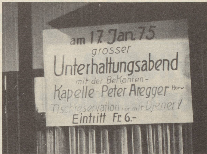
Vor einem Berggasthaus auf dem Albis

gewidmet ist, stattfinden könne. Die Künstler fanden die Idee sehr kuht pardon gut und durchaus keine Kalberei und schickten.