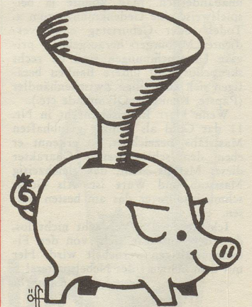
Sparidee für Kurzsichtige