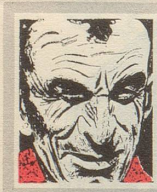
Us em Innerrhoder Witz- tröckli

Ame Mektig het en Frönte ame Puur zueglueged, wie'ner en Schöblig mit de baare Heng gesse het. Er het si draa ene uufgret und het gsäat: «Zom Esse neet en aastendige Mensch Messer ond Gable!» De Puur aber meent: «Gölt ase, ond mit was häbt er denn de Schöblig?» Hannjok