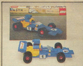
392 Formel 1-Rennwagen «Team LEGO».