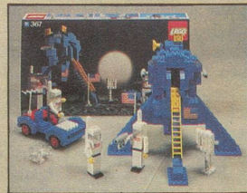
367 LEGOLAND Astronauten mit Mondlandefähre.