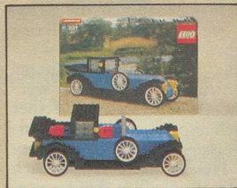
391 Renault Baujahr 1926.