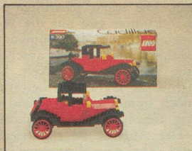
390 Cadillac Baujahr 1913.