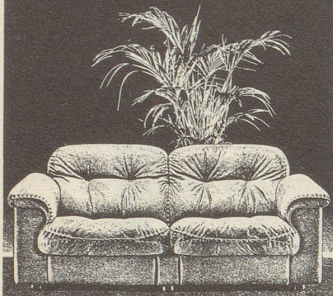
De Sede AG, 5313 Klingnau