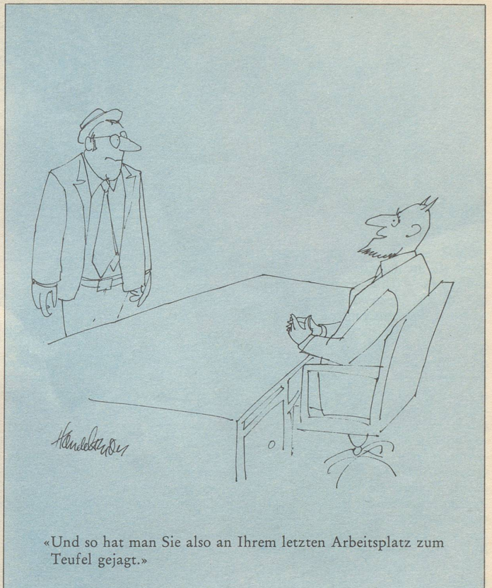
«Und so hat man Sie also an Ihrem letzten Arbeitsplatz zum Teufel gejagt.»

«Was ist denn, Papa? Trinkst die Mama nicht auch ein Glas?»