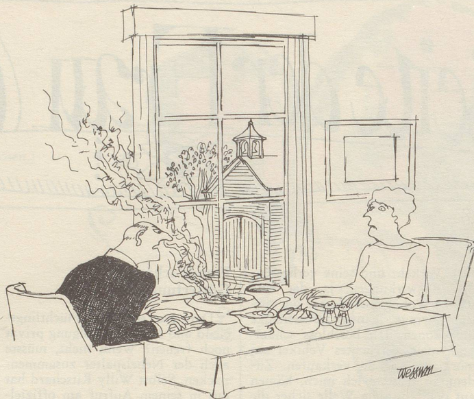
«Es riecht, wie wenn du vor dem Kochen nicht gebetet hättest.»