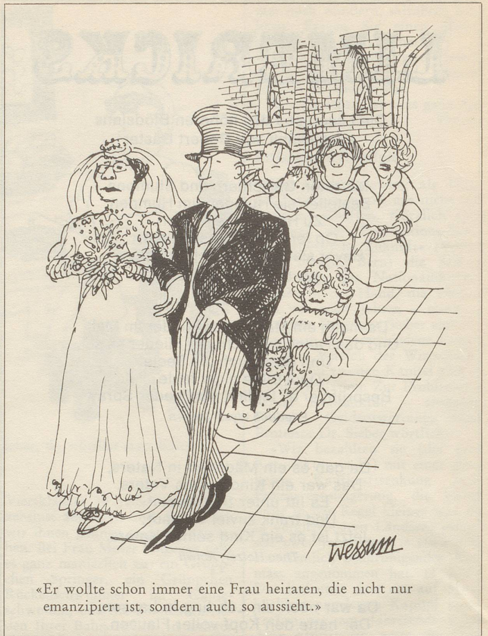
«Er wollte schon immer eine Frau heiraten, die nicht nur emanzipiert ist, sondern auch so aussieht.»

Und deshalb weiss ich, dass unsere Armee für die nächsten 100 Jahre gerettet ist. Unter dem oben beschriebenen Bild hiess es nämlich wörtlich: «Das Armeespiel brachte dem vollzähligen Bundesrat im Bundeshaus ein Ständchen zum hundertjährigen Geburtstag der Schweizer Armee.» Man denke – Welch ein Fest! Ein Geburtstag, der hundert Jahre lang dauert,