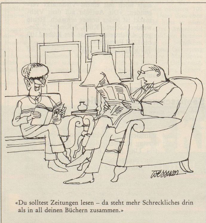
«Du solltest Zeitungen lesen – da steht mehr Schreckliches drin als in all deinen Büchern zusammen.»