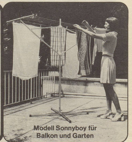
Modell Sonnyboy für Balkon und Garten