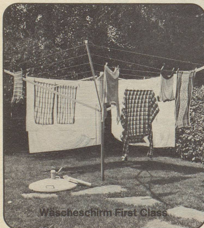
Wäschschirm First Class

HOTEL HERTENSTEIN 6352 HERTENSTEIN 100 Betten Familie Jahn Tel. 041 / 93 14 44. Telex 72248