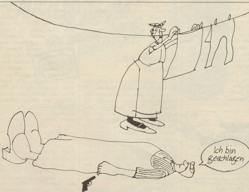
... dank jenen, die in echtem Pioniergeist nach neuesten Waschmitteln Ausschau halten ...