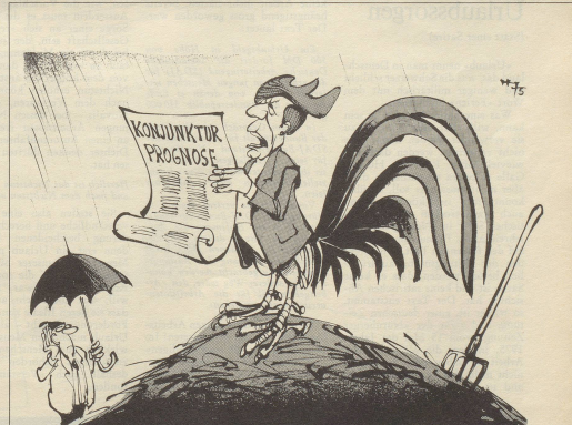
Wenn der Hahn kräht auf dem Mist, ändert sich das Wetter oder es bleibt wie's ist!