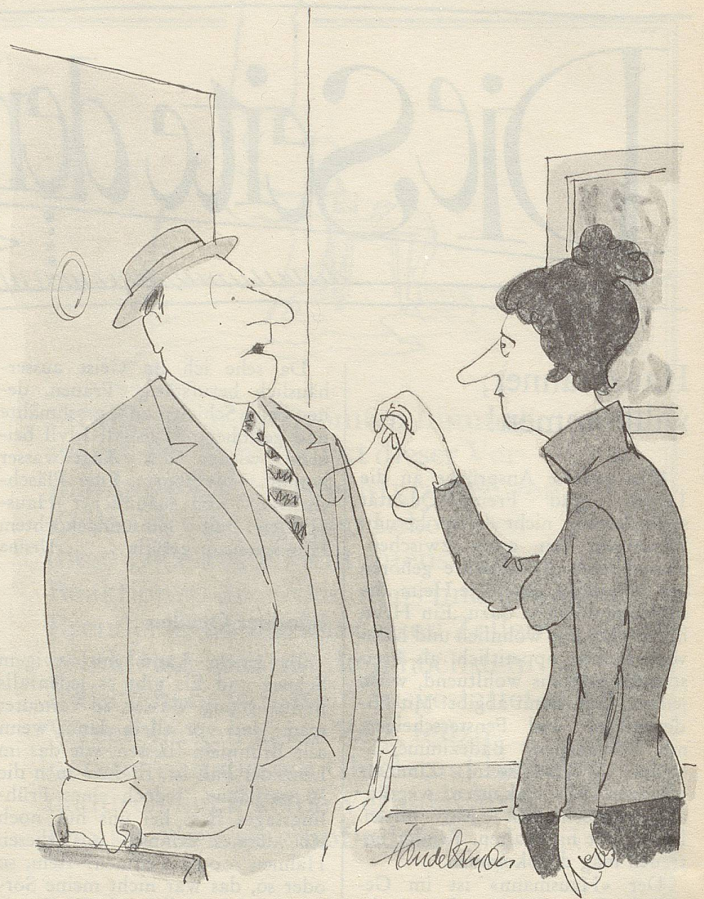
«Da war im Eisenbahnabteil ein kleines Kind mit langem blondem Haar, das hat mir die Brieftasche geklaut.»

Als meine Schwester eine Brille brauchte, lachte ich sie wegen ihrer Komplexe aus, und meiner Mutter rede ich immer wieder zu, wie hilfreich ein Hörapparat sein kann. Der Tante sagte ich, das neue Gebiss mache sie sogar vorteilhafter. So normal bin ich.