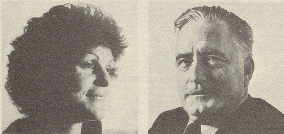
Georges André Chevallaz Bundesrat