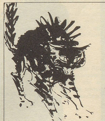
WAAGHAUS ST. GALLEN

Antwort: Im Prinzip schon; er probiert augenblicklich den Ritt auf dem Tiger. Diffusor Fadinger