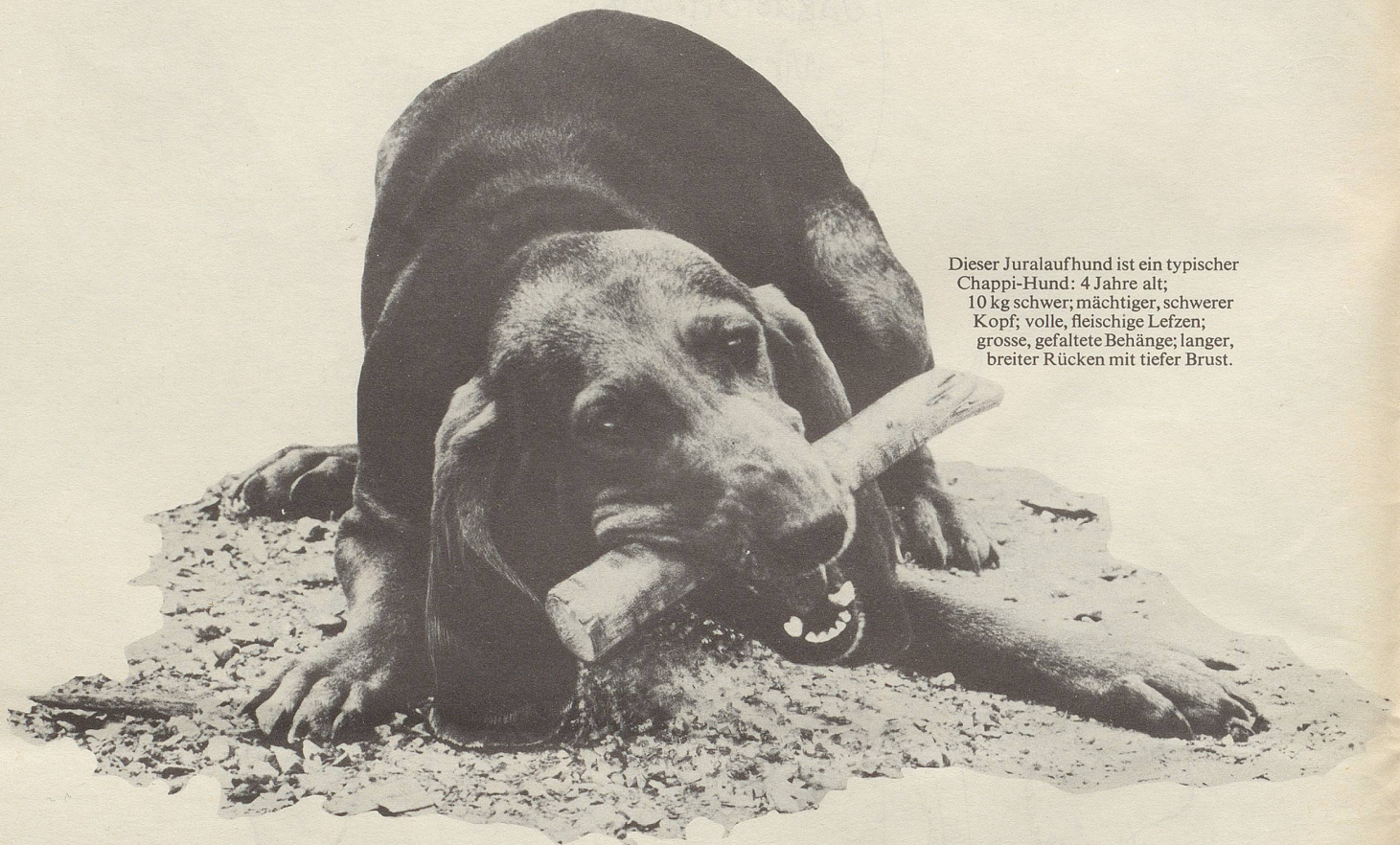
Dieser Juralaufhund ist ein typischer Chappi-Hund: 4 Jahre alt; 10 kg schwer; mächtiger, schwerer Kopf; volle, fleischige Lefzen; grosse, gefaltete Behänge; langer, breiter Rücken mit tiefer Brust.