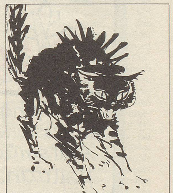
WAAGHAUS ST. GALLEN

Ich würde gerne auch die Forderung aufstellen, dass die Männer die Möglichkeit kriegen müssen, Kinder zu gebären, damit sie Kinder haben können, ohne gezwungen zu sein, sich deshalb eine Frau an den Hals zu binden. Diese Forderung ist jedoch bei dem heutigen Stand der Wissenschaft noch unrealistisch. Ich bin ja keine Men Lib., ich bin ein ganz gemässigter Männerrechtler. Ich glaube, dass man aufgrund dieses Programms das Jahr der Frau und das Jahr des Mannes ruhig gleichzeitig durchführen kann.