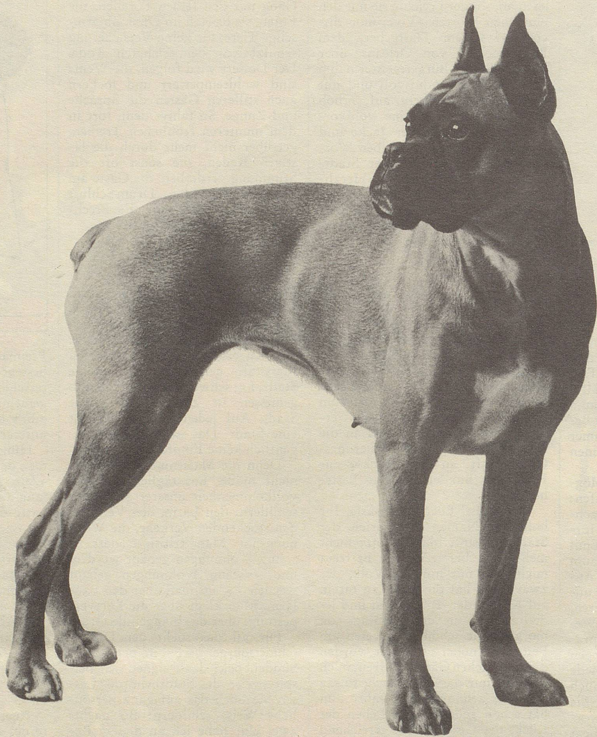
Dieser Boxer ist ein typischer Chappi-Hund: 2 1/2 Jahre alt; 25 kg schwer; schnittig; eleganter, gesunder Körperbau; kräftiger Kopf; dicke Lefzen. Hat Leistungsprüfungen bestanden.